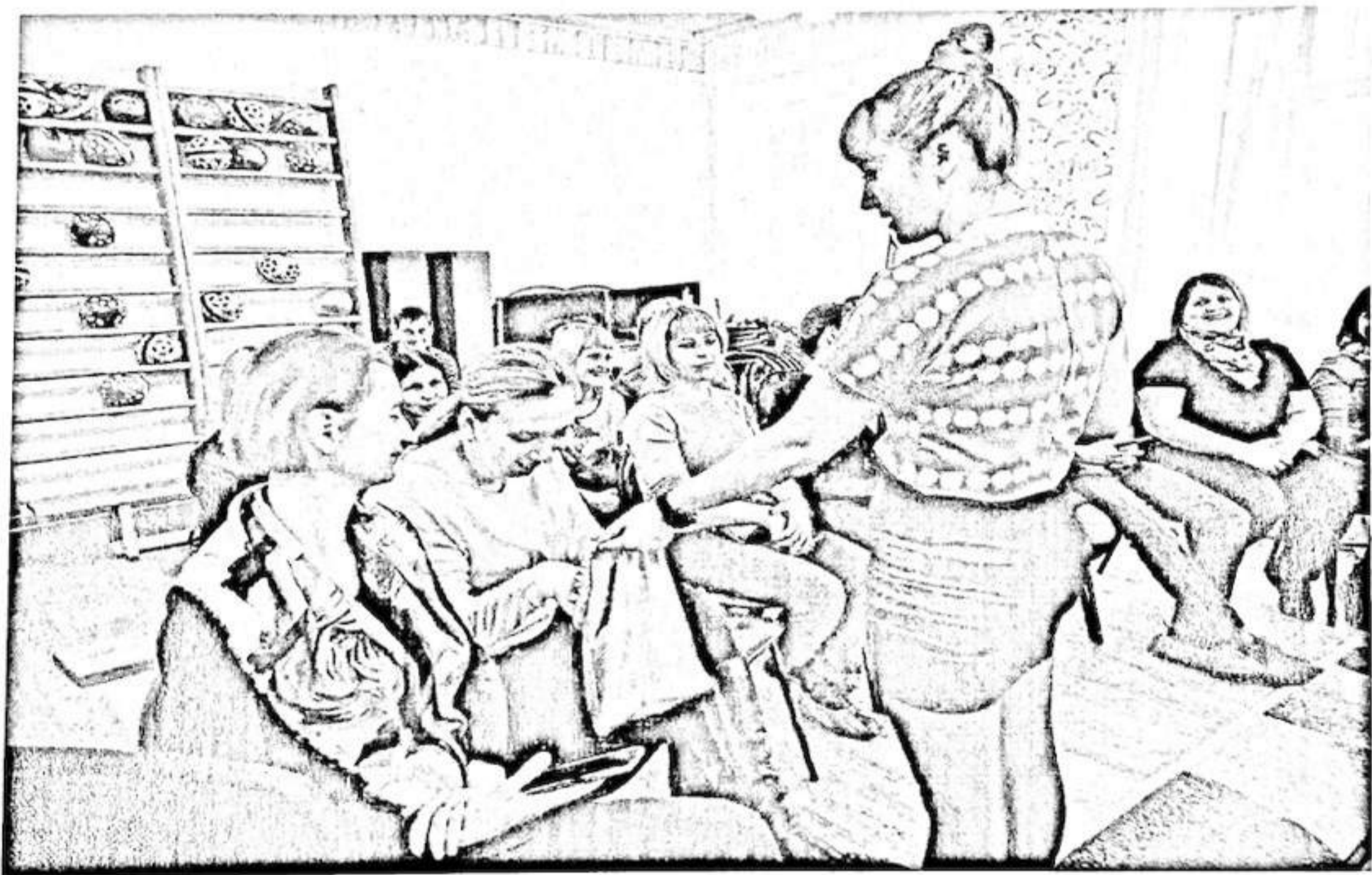
Мастер-класс «Игры и игровые упражнения по развитию речи»

Заведующий МБДОУ детский сад №21 г.Павлово