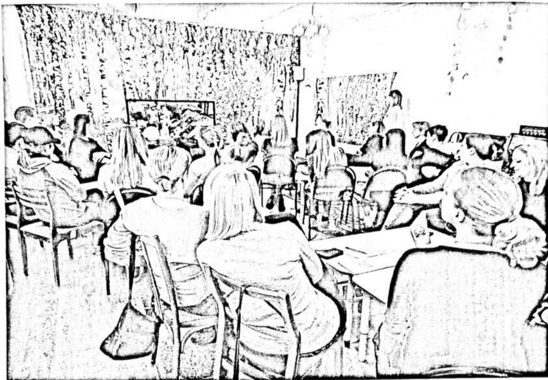
Экофест «друзья природы»