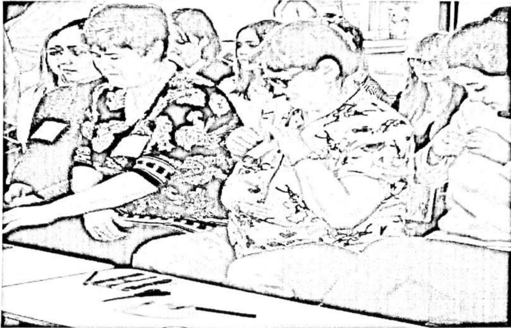
Брей-ринг «Развитие и воспитательные воздействия сказок А.С.Пушкина»