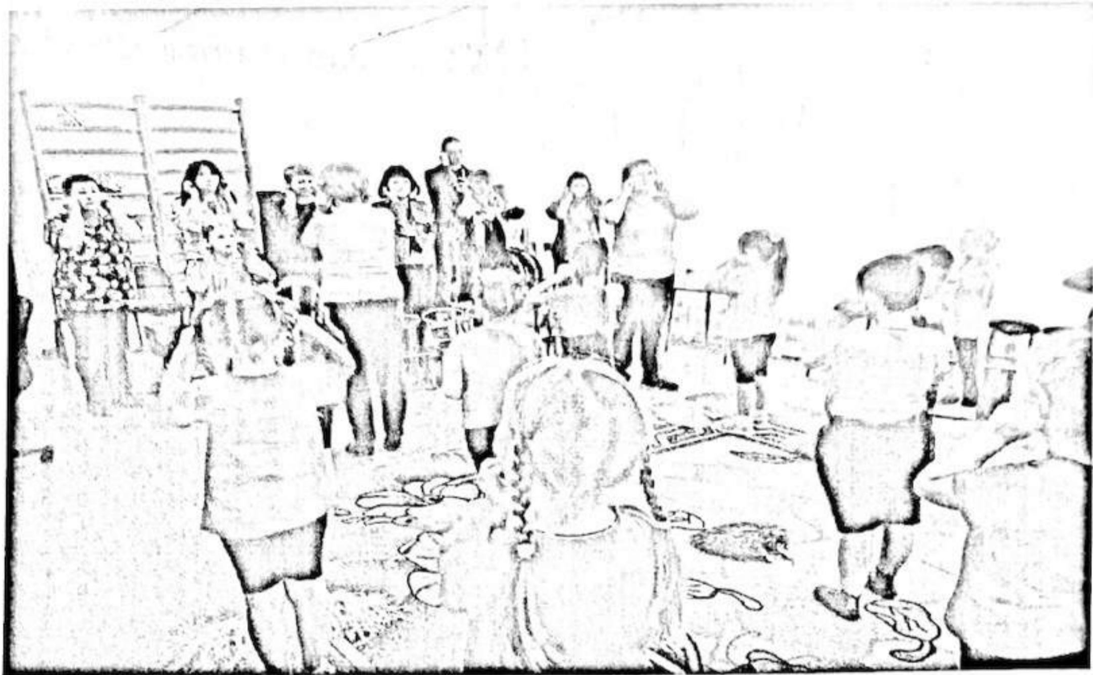
Брифинг «Как помочь ребенку стать внимательным»